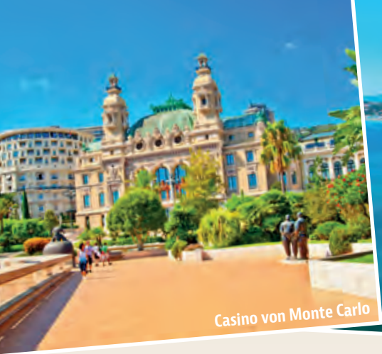
Casino von Monte Carlo