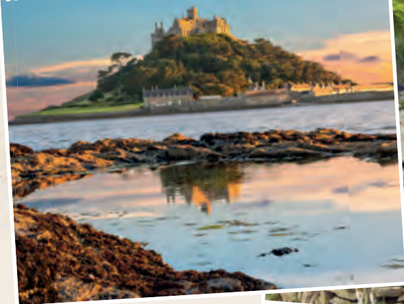
St. Michael's Mount