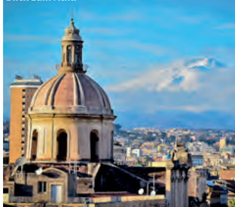
Blick zum Ätna

Ätna und 1693 durch ein schweres Erdbeben völlig zerstört und danach im Barockstil wieder aufgebaut. Bei der kurzen Panoramafahrt sehen Sie die berühmte Via Etnea mit ihren Barockpalästen und -kirchen sowie den prachtvollen Dom. Letzter Stopp ist in Cefalu. Aufgrund des langen Sandstrandes, dem riesigen Felsen am Meer und der wunderschönen Altstadt ist Cefalu einer der bekanntesten und beliebtesten Städte Siziliens. Wir besuchen den von außen wuchtigen und von innen prächtigen Normannendom* und die am Meer gelegene arabische Waschanlage. Im Raum Cefalu/ Palermo laden wir Sie zu einem frühen Abschiedsabendessen ein. Danach erfolgt die Einschiffung auf der Grandi Navi Veloci und die Überfahrt nach Genua zwischen 21.00 und 23.00 Uhr.