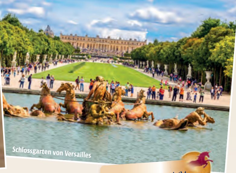
Schlossgarten von Versailles